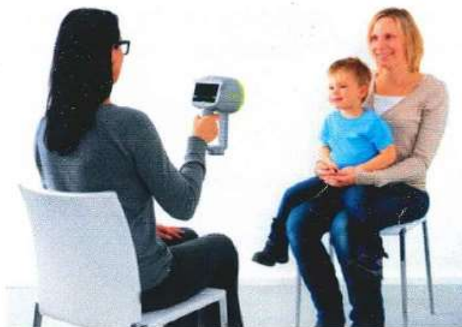
Realização do exame de rastreio

O resultado é enviado por carta para a sua residência. A sua equipa de saúde familiar também recebe essa informação.